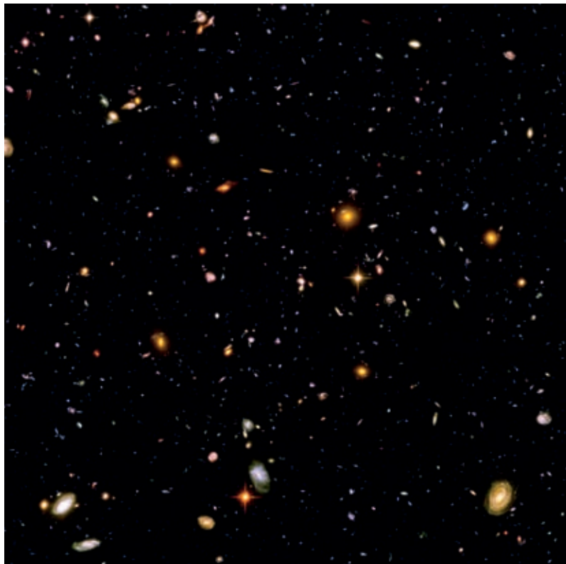
Hubble Ultra Deep Field, NASA, EAS, E. Beckwith (STScI) & the HUDF Team

Cette proposition de l'Ircam et de l'Ensemble intercontemporain pour le Nouveau Festival du Centre Pompidou agence virtuosité instrumentale, pari technologique et analogie scientifique. Pour Hèctor Parra, l'espace ou la nature des physiciens constitue le modèle poétique de plusieurs œuvres. Stress Tensor désigne ainsi la beauté comme « tenseur de stress, d'énergie et d'impulsion ». L'espace de Michaël Levinas est l'espace acoustique du piano, sa « grotte-caisse » avec tous les effets de résonance et d'éloignement que crée son Étude conçue à la Villa Médicis. Les compositeurs les plus jeunes de ce concert, Lara Morciano et Vassos Nicolaou, envisagent quant à eux ce qui provoquera l'interprète sur son terrain de prédilection, la virtuosité, reculant de la même façon les limites de l'instrument et du logiciel. Nature physique et nature de l'artefact instrumental se confondent ainsi dans l'invention artistique.