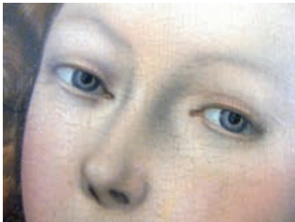
Lucretia (détail), Cranach le jeune, c. 1525

Les Exercices du silence envisagent un théâtre de l'aphasie et de l'extase, conçu à partir des textes d'une mystique du XVII e siècle qui se fit appeler Louise du Néant. Touchant aux limites de l'instrumental et du vocal, l'écriture se concentre ici sur la voix, nouée au piano et à l'électronique, basculant de l'ascétisme à l'illumination absolue. Après la première version de 2008 créée lors du Festival d'Automne à Paris, les