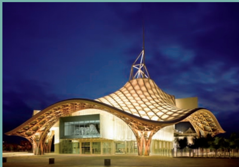
Centre Pompidou-Metz, mai 2010 © Shigeru Ban Architects Europe et Jean de Gastines Architectes / Metz Métropole / Centre Pompidou-Metz / Photo Roland Halbe